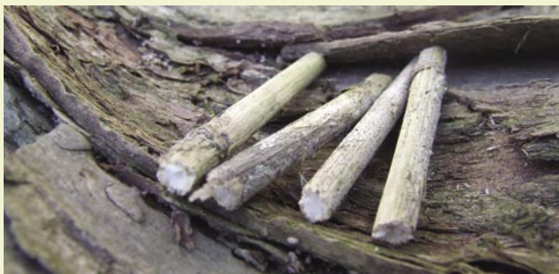
Patyki z klonu jesionolistnego

Występuje praktycznie wszędzie. Zwłaszcza w miejscach dobrze oświetlonych.