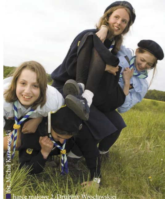
■ fot. Michał Karaszewski