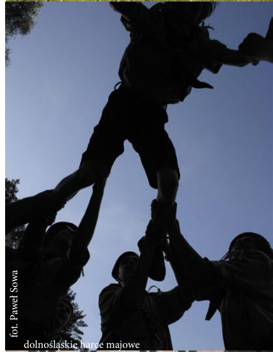
■ fot. Paweł Sowa