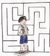
■ rys. Anna Pizoń