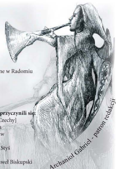
Archanioł Gabriel - patron redakcji